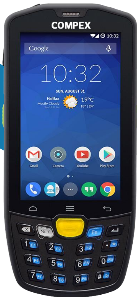
COLETOR DE DADOS AUTOID9 Plus