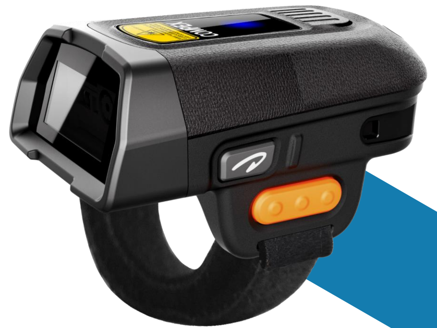
LEITOR DE CÓDIGO DE BARRAS R70