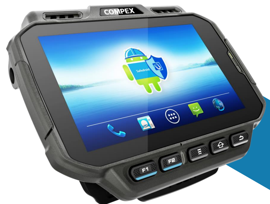
COMPUTADOR VESTÍVEL U2 BLUETOOTH