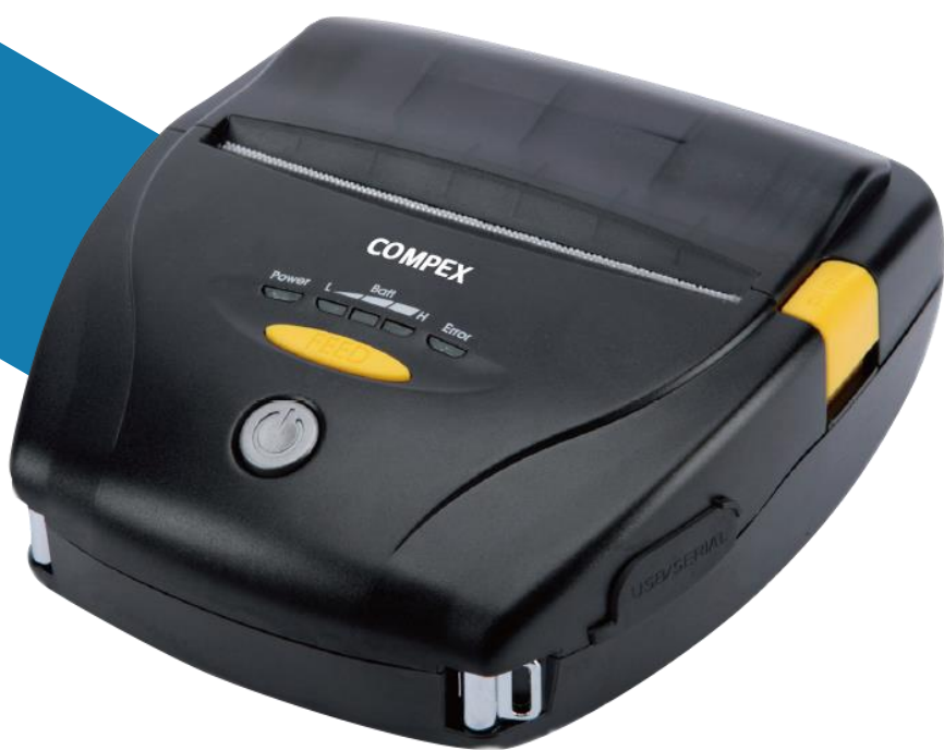
IMPRESSORA PORTÁTIL LKP 41